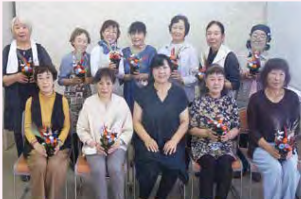
プリザーブドフラワー教室