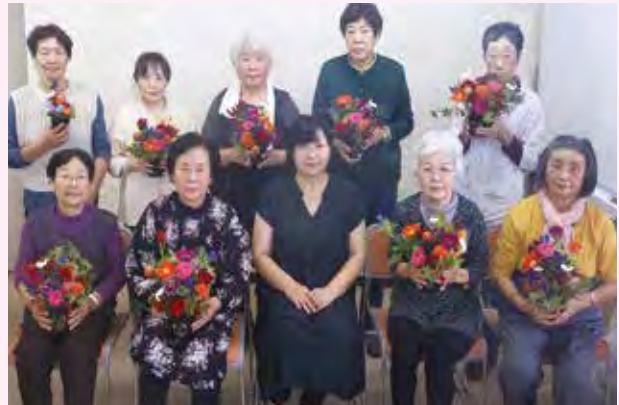
フラワーアレンジ教室