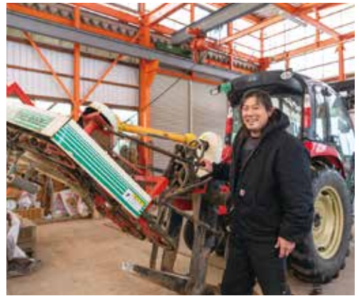
先輩農家さんのごぼう収穫機が活躍