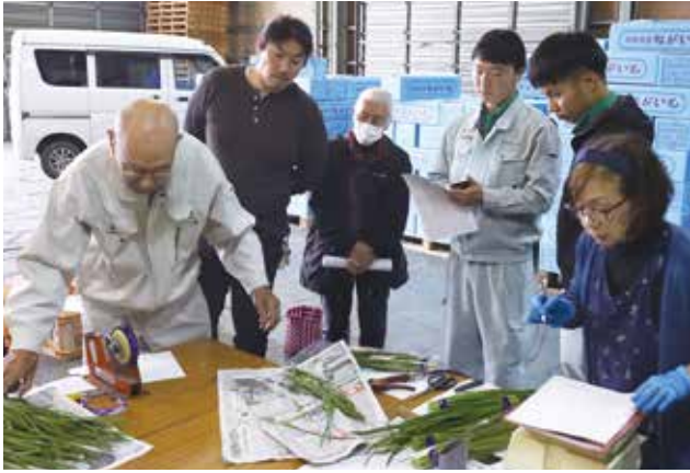
出荷規格を確認する生産者たち